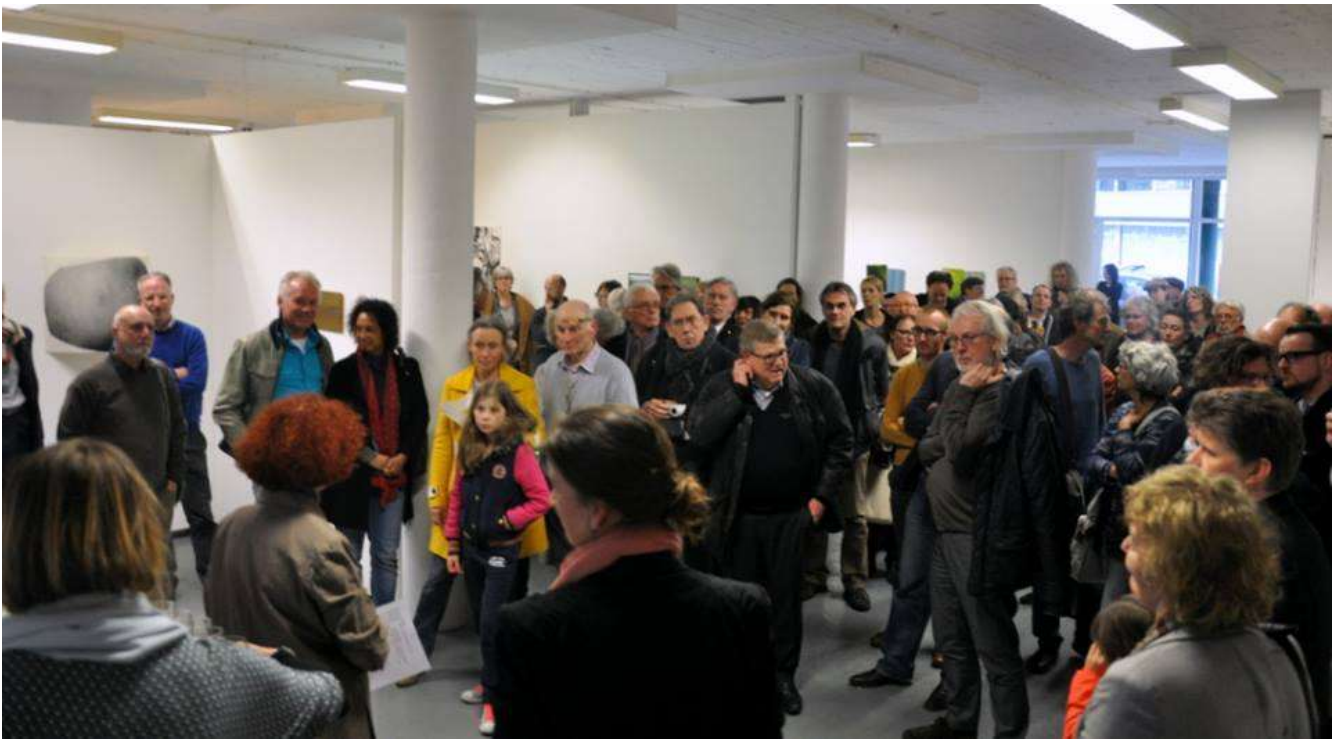
Locatie Van Vollenhovenstraat 14, Rotterdam