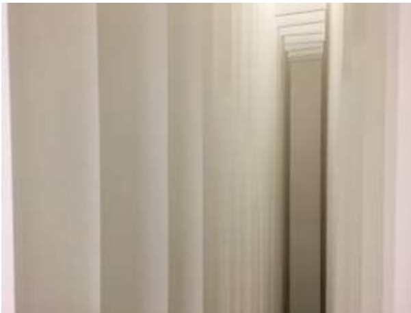
Lieven Poutsma, Talent Room