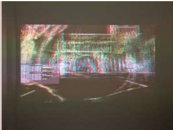
Marnix de Gijs, Video Room