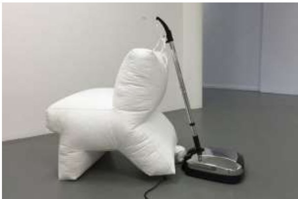
Studio Makkink & Bey

PR: Gedrukte flyer, persbericht, free publicity (publiekskrant Art Rotterdam/artikel NRC/ drukwerk Museumnacht), extra dag- en avondopenstelling, social media Begunstigers: Het project SuperLandEscape kwam mede tot stand met steun van Gemeente Rotterdam, G.Ph.Verhagen Stichting en PROOFF